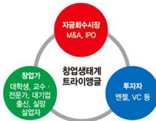
[그림 1-1-2] 창업생태계 트라이앵글