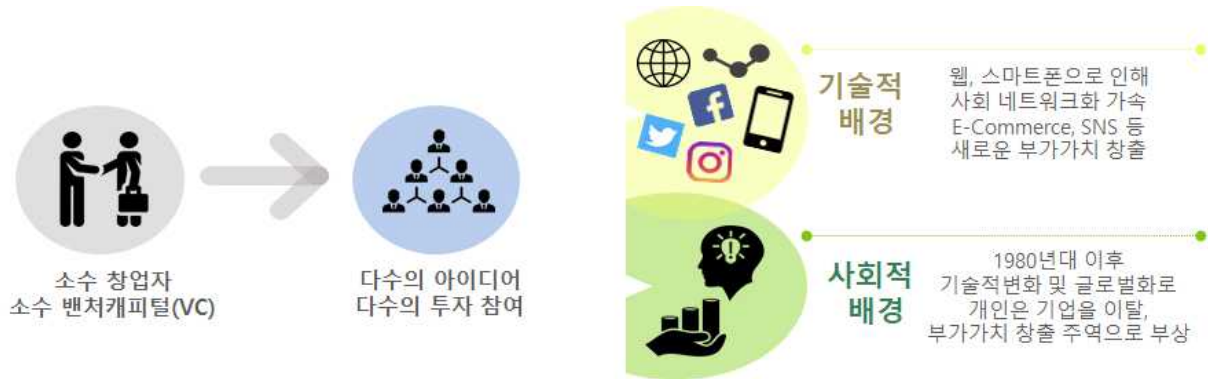
[그림 1-1-1] 창업 환경 변화로 인한 창업 생태계 변화